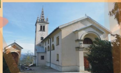
Dolenja vas in Sv. Lenart