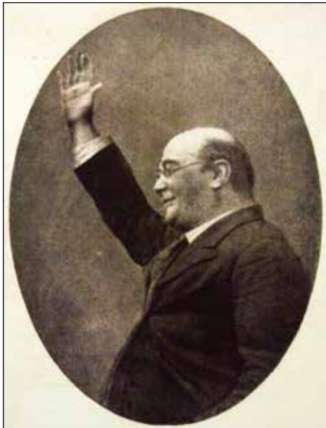
Portret dr. Janeza Evangelista Kreka.