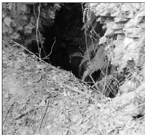
Slika 1: Vhod v rudnik, marec 1995.

rovih v okolici Železnikov. Imel sem jih že več kot petdeset, ko sem se ga napotil iskat. Šel sem po Smolevski grapi do mesta, kjer se cesta usmeri na levo proti Smolevi. Tu me je medel spomin iz mladosti usmeril na desno v nasprotni hrib, na Vancovec. Kmalu sem v gozdu naletel na staro vlako, ki me je v zavojih vodila gor, naravnost pred vhod v rudnik. Obstal sem razočaran. Od mojih pričakovanj in rudnika iz moje mladosti ni ostalo nič. Izvozna rampa je bila zasuta, vhod v rudnik pa podsut. Skozi majav in krušljiv, skoraj do vrha zasut vhod (slika 1) sem