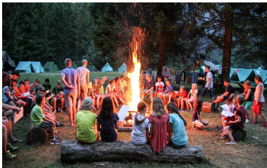
Slika 2: Taborniki, Rod zelene sreče Železniki