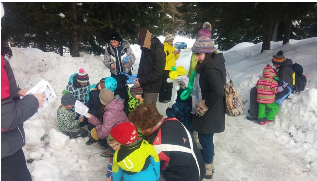
Slika 12: Zimsko dogajanje na Soriški planini