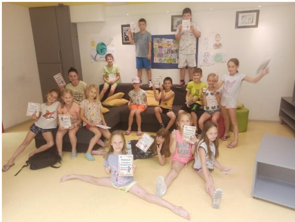
Slika 1: Gusarski teden v okviru MCŽ

5. Mladinsko delo je organizirana in ciljno usmerjena oblika delovanja mladih in za mlade, v okviru katere mladi na podlagi lastnih prizadevanj prispevajo k lastnemu vključevanju v družbo, krepijo svoje kompetence ter prispevajo k razvoju skupnosti. Izvajanje različnih oblik mladinskega dela temelji na prostovoljnem sodelovanju mladih ne glede na njihove interese.