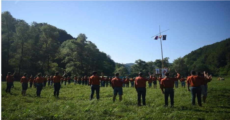
Slika 1: Skavti - Žilavi Žeblički Železniki