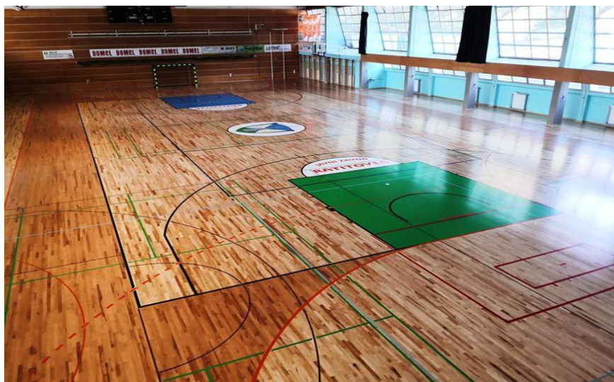
Slika 5: Športna dvorana Železniki

Športna dvorana Železniki ima veliko in malo dvorano. Površina športnega objekta je 2.344 m 2 . Tribune v glavni dvorani sprejmejo 500 gledalcev. Objekt obratuje povprečno 3.000 ur na leto. Velika dvorana je namenjena šolski športni vzgoji, športni vadbi, športni rekreaciji ter tekmovanjem v košarki, rokometu in odbojki. Veliko dvorano se lahko z dvema pregradama razdeli na tri dele in tako lahko naenkrat sprejme več različnih uporabnikov. V veliki dvorani potekajo tudi glasbeni koncerti in druge kulturne prireditve. Mala dvorana je primerna za izvajanje športnih aktivnosti manjšega obsega, predvsem za vadbo različnih plesov, gimnastičnih in fitnes programov. V njej se lahko odvijajo tudi manjše prireditve, podelitve in seminarji. V pritličju se nahaja klubski bife. Dvorana, ki jo vsako leto obiše preko 100.000 uporabnikov in obiskovalcev, je v upravljanju Javnega zavoda Ratitovec, prav tako tudi Športni park Dašnica in Plavalni bazen Železniki.