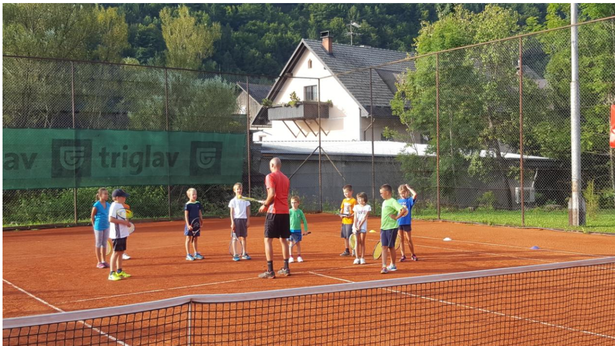
Slika 14: Tenis tečaj v okviru JZR