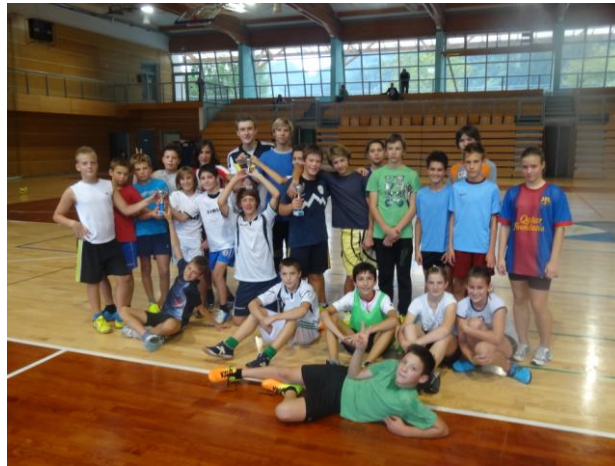
Slika 15: Nogometni turnir za otroke