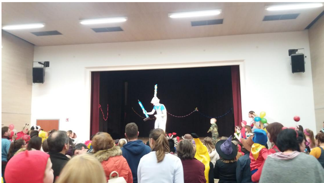
Slika 13: Pustno rajanje v Kulturnem domu