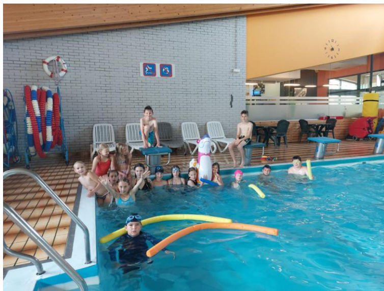
Slika 9: Plavalna delavnica v MCŽ