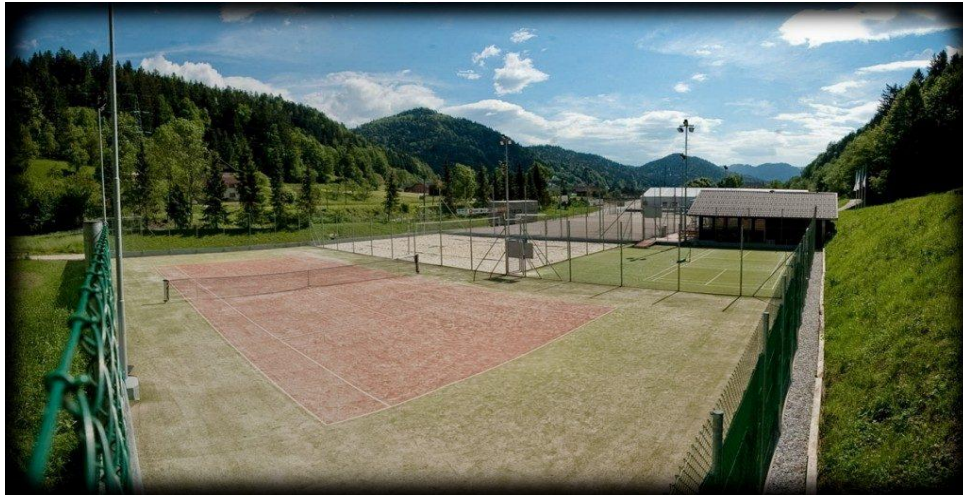
Slika 8: Športni park Rovn

Športni park Rovn je rekreacijski park v Selcih, v upravljanju Športnega društva Selca. Urejena so igrišča za nogomet, odbojko na mivki in tenis, na večnamenski ploščadi pa so postavljeni koši in goli. V zimskem času je na tej ploščadi urejeno drsališče. Na športnem parku se nahaja še gostinski lokal z vrtom, poleg pa je tudi otroško igrišče. Športni park Rovn leži ob reki Sori, kjer nudijo možnost najema prostora za piknik. Na območju parka se nahaja tudi manjši kamp z urejenimi sanitarijami, tuši ter električnimi priključki.