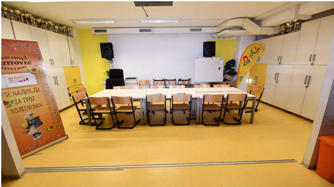
Slika 4: Mladinski center Železniki

Poleg vsebin za mlade v mladinskem centru občasno gostimo tudi Ljudsko univerzo Škofja Loka s programi za starejše.