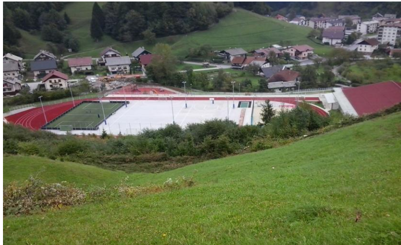
Slika 6: Športni park Dašnica

V športnem parku so urejena igrišča za roket, košarko, odbojko na mivki in mali nogomet (umetna trava), med igriščema za odbojko in košarko je prostor za skok v daljino in troskok, ob novem opornem zidu pa za met krogle in skok v višino. Urejeno je tudi sodobno otroško igrišče z igrali za otroke vseh starostnih obdobj. V zimskem času je urejeno tudi drsališče.