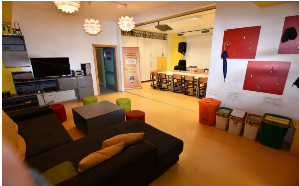
Slika 2: Mladinski center Železniki