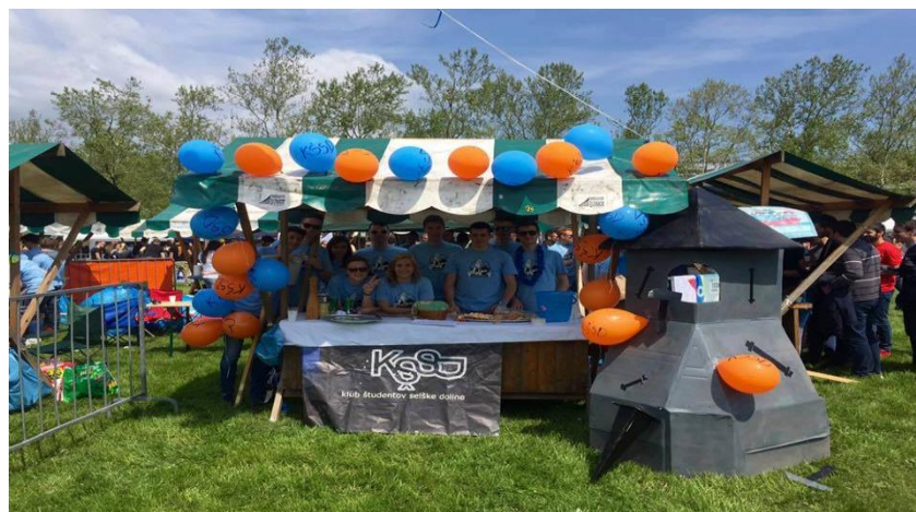
Slika 3: Klub študentov Selške doline Železniki